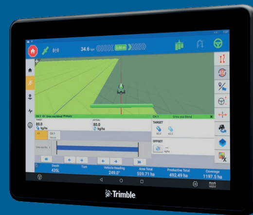
Display GFX-1060 schermo da 25 cm

I display GFX sono facilmente modulabili e adattabili, in modo da poter effettuare senza problemi aggiornamenti alle dimensioni dello schermo, ai sistemi di posizionamento e di guida o alle esigenze di implementazione ampliate.