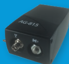
Pridėkite antrą L1 / L2 anteną