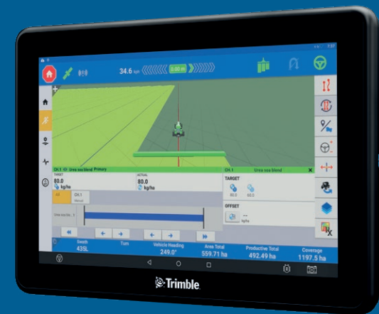
GFX-1060 displejs 25 cm ekrāns

GFX displejus var pavisam vienkārši mērogot un pielāgot, tāpēc varēsiet bez problēmām mainīt ekrāna izmēru, novietojumu un stūres vadības sistēmas vai arī paplašināties līdz ar augošajām agregātu vajadzībām.