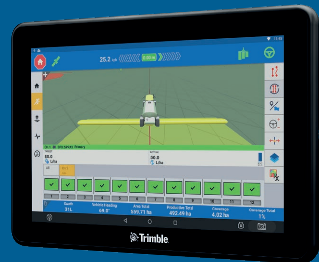
GFX-1260 displeje 30 cm obrazovka

Displeje GFX lze snadno modernizovat a uzpůsobit, takže můžete bez problémů změnit velikost obrazovky, či rozšířit systém polohování a navádění nebo řešení přizpůsobit potřebám vašeho nářadí.