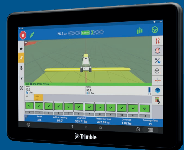
Navigacija GFX-1260 ekran 30 cm

GFX navigacije omogućuju jednostavnu prilagodbu sustava ovisno o Vašim potrebama za nadogradnju većim ekranom, sustavom upravljanja i pozicioniranja, ili dodatnim potrebama priključnih strojeva.