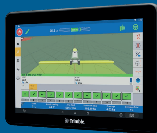
GFX-1260 displejs 30 cm ekrānu

GFX displejus var pavisam vienkārši mērogot un pielāgot, tāpēc varēsiet bez problēmām mainīt ekrāna izmēru, novietojumu un stūres vadības sistēmas vai arī paplašināties līdz ar augošajām agregātu vajadzībām.