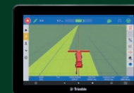
GFX-1060 25 cm (10 palcev)