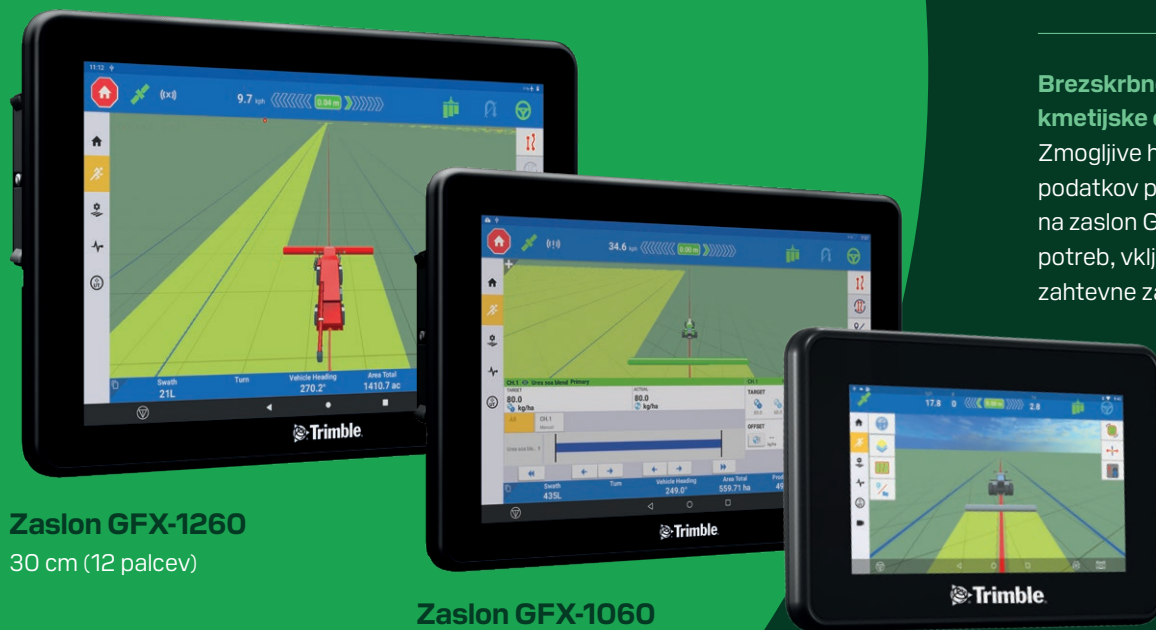
Zaslon GFX-1260 30 cm (12 palcev)