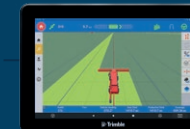
GFX-1060 cu ecran de 25 cm