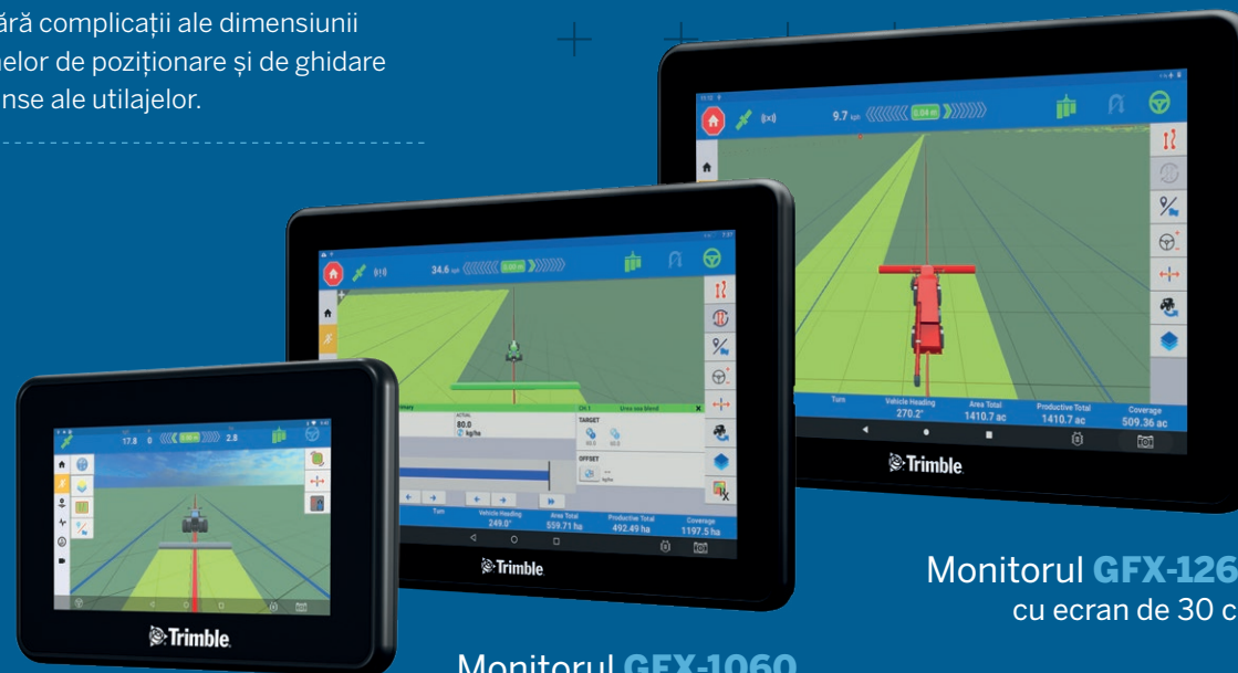
Monitorul GFX-350 cu ecran de 17 cm

precum AutoSync™, dar și Work Orders de la distanță mențin atenția echipei, în vreme ce compatibilitatea prin CAN pentru analiza datelor asigură funcționarea corespunzătoare a flotei.