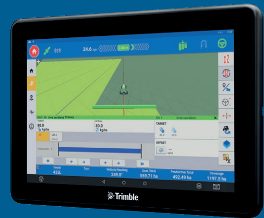
Écran GFX-1060 Écran de 25 cm

Les écrans GFX évoluant et s'adaptant facilement, vous pouvez sans problème effectuer des mises à jour de votre taille d'écran, de vos systèmes de positionnement et de guidage, ou de vos besoins d'outils étendus.